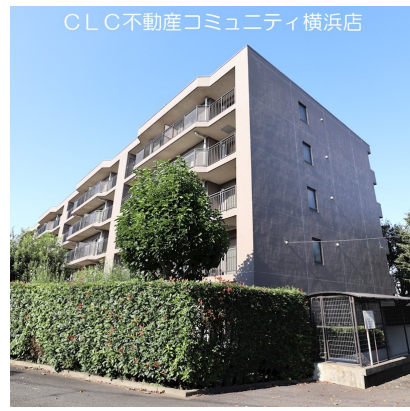
CLC不動産コミュニティ横浜店