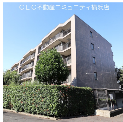
CLC不動産コミュニティ横浜店