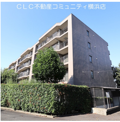
CLC不動産コミュニティ横浜店